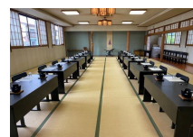
大広間 64 畳

「干渉波自動回避機能」を搭載、コードレス電話機など Wi-Fi 以外の機器から出るノイズを自動で検知し干渉しないチャンネルへ自動で変更します。 通信規格は「11ac」に対応、大容量データも短時間送信、ダウンロードもスムーズです。1台のアクセスポイントで最大 256 台の同時接続が可能です。