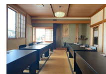
小部屋 20 畳